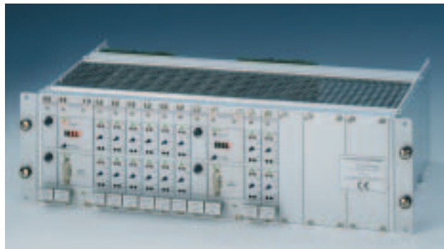
Bild 4: Innenanlage des Achszählsystems ACS2000 - 19"-Baugruppenträger zur Überwachung von zwei Achszählabschnitten (einer mit sechs und einer mit zwei Zählpunkten)

Bereits bei der Planung zeigen sich die Vorteile des einfachen und übersichtlichen Aufbaus. Nach Vorlage des Gleisisolierplans kann innerhalb kürzester Zeit das Achszählsystem projektiert werden. Die anlagenspezifisch bereits fertig konfigurierten Baugruppenträger werden der Signalanlage zugestellt und dort über die Kabelanlage mit den Zählpunkten verbunden.