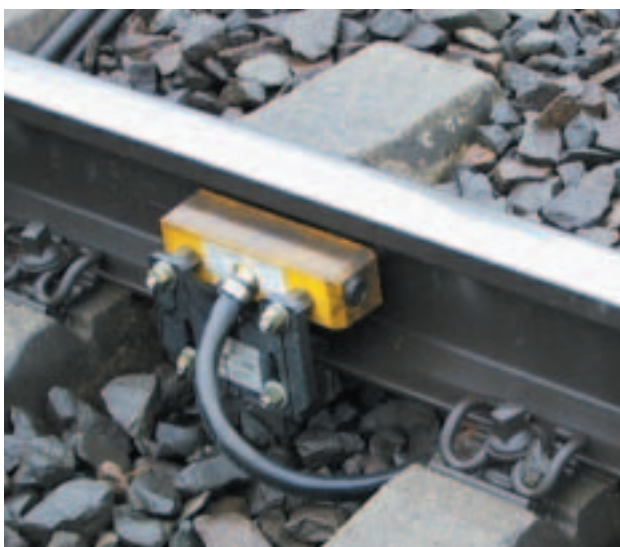
Bild 2: Zählpunkt mit Rad-sensor RSR122 montiert auf Schienenklaue

Freimeldung eines Abschnitts an zwei Betriebsstellen bereitgestellt werden soll, können zwei Achszählbaugruppen ACB über eine serielle Verbindung (RS232-Modems) kommunizieren. Die Kommunikation erfolgt gemäß EN 50159-1 für signaltechnisch sichere Kommunikation in geschlossenen Netzen. Der Abstand der beiden Betriebsstellen voneinander ist nur durch die Leistungsfähigkeit des Übertragungssystems limitiert. Eine zweite serielle Schnittstelle auf der Frontseite der Baugruppe ermöglicht den Anschluss eines handelsüblichen Laptops zum Auslesen und Auswerten von Diagnoseinformationen.