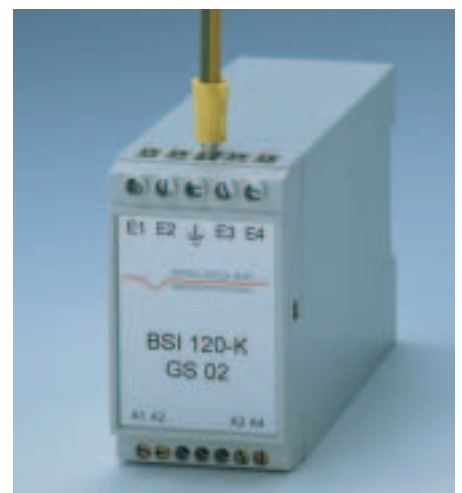
Bild 3: Blitzschutzmodul BSI120-K zur Ableitung von Überspannungen