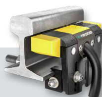
RSR123v (Typ RSR123-004)